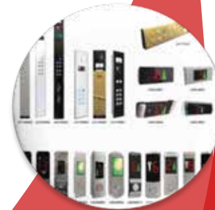
Botoneras o Mandos Internos