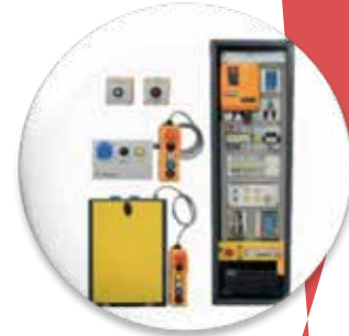
Tablero Todo Incorporado con Sistema de Rescate