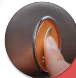
Llamada Técnica de Emergencia (Directa a Servicio)