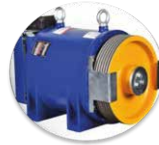
Motor de Imanes Permanentes de Alta Eficiencia